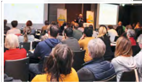
Praxistag HPLC in Berlin

Der Praxistag HPLC ist in dieser Form einzigartig im deutschsprachigen Raum. Die Teilnehmer schätzen vor allem die Hands-on-Workshops sowie die digitale Interaktion mit den Referenten im Live-Chat und den Erfahrungsaustausch vor Ort.