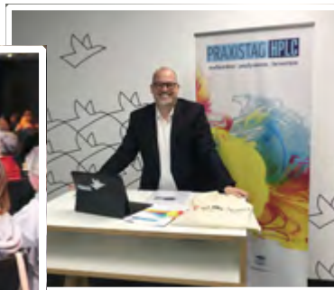
Praxistag HPLC Webkonferenz