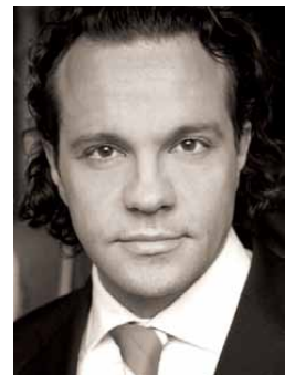
Moderation: Sven Robin