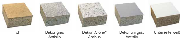
roh Dekor grau Antislip Dekor „Stone“ Antislip Dekor uni grau Antislip Unterseite weiß