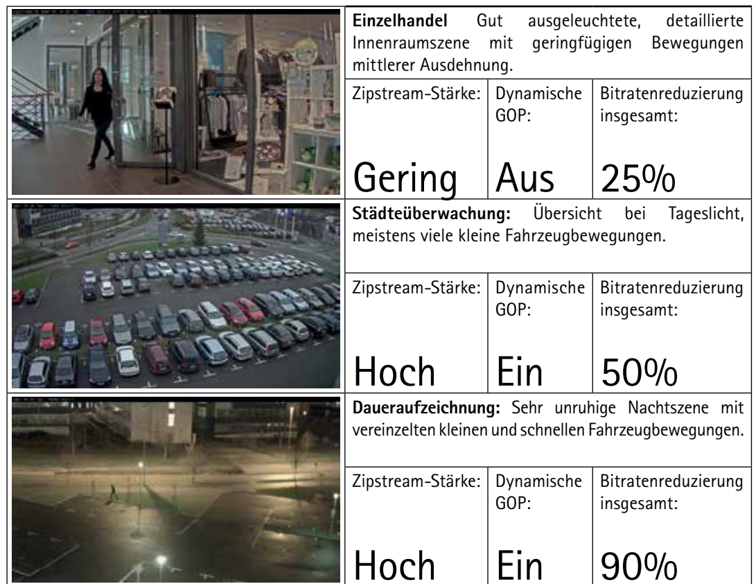
Abbildung 2: Beispiele für Überwachungsszenen, in denen Zipstream den Speicherbedarf senken kann. 1

Abbildung 2 zeigt Beispiele für Überwachungsszenen, in denen die Zipstream-Technologie von Axis den Speicherbedarf senken kann. Die Tabelle zeigt die Zipstream-Stärke und ob dynamische GOP aktiviert waren sowie die Reduzierung der Bitrate insgesamt.