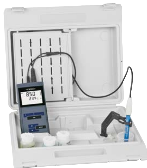
Set im Tragekoffer

Für weitere Informationen besuchen Sie unsere Website: www.WTW.com/de/armierung