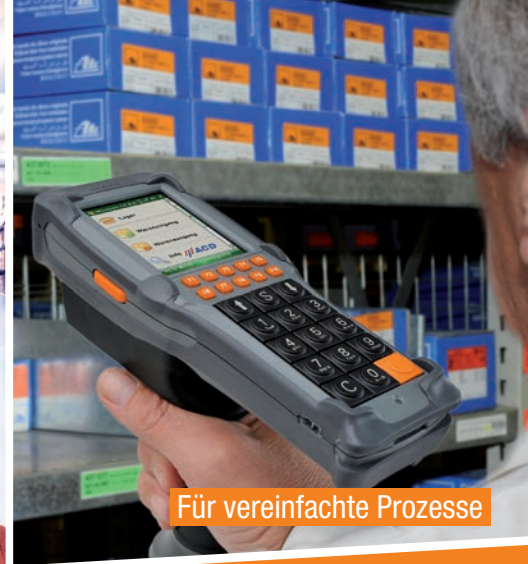
Für vereinfachte Prozesse