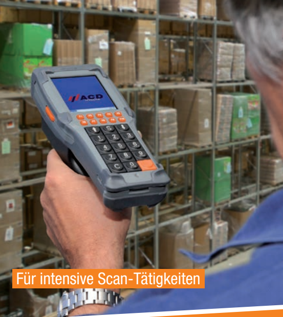
Für intensive Scan-Tätigkeiten