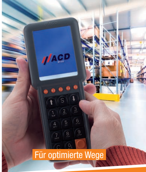
Für optimierte Wege