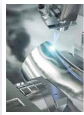
Halbschalen mit Laser verschweißen