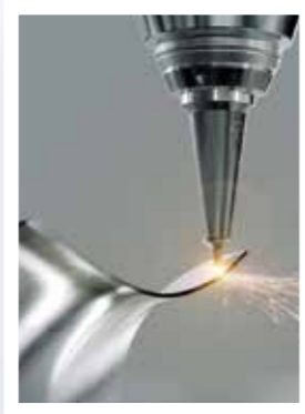
Lasertrimmen der Halbschalen