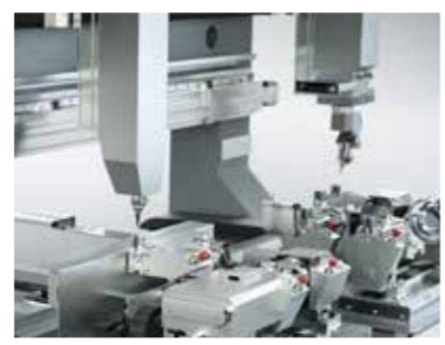
Arbeitsbereiche Abhängig vom Anlagenkonzept variiert der Arbeitsbereich zwischen 1000 mm und 2200 mm Breite