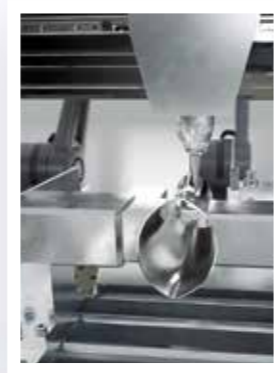
Laserschneiden des Lochs