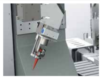
Bearbeitungsoptiken: Schneidoptiken, Schweißoptiken, Scanner, Rotationsoptiken und Kombinationen