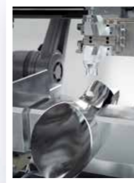
Automatisiertes Zuführen der Gewindebuchse