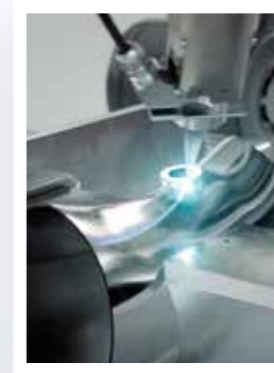
Laserschweißen der Gewindebuchse