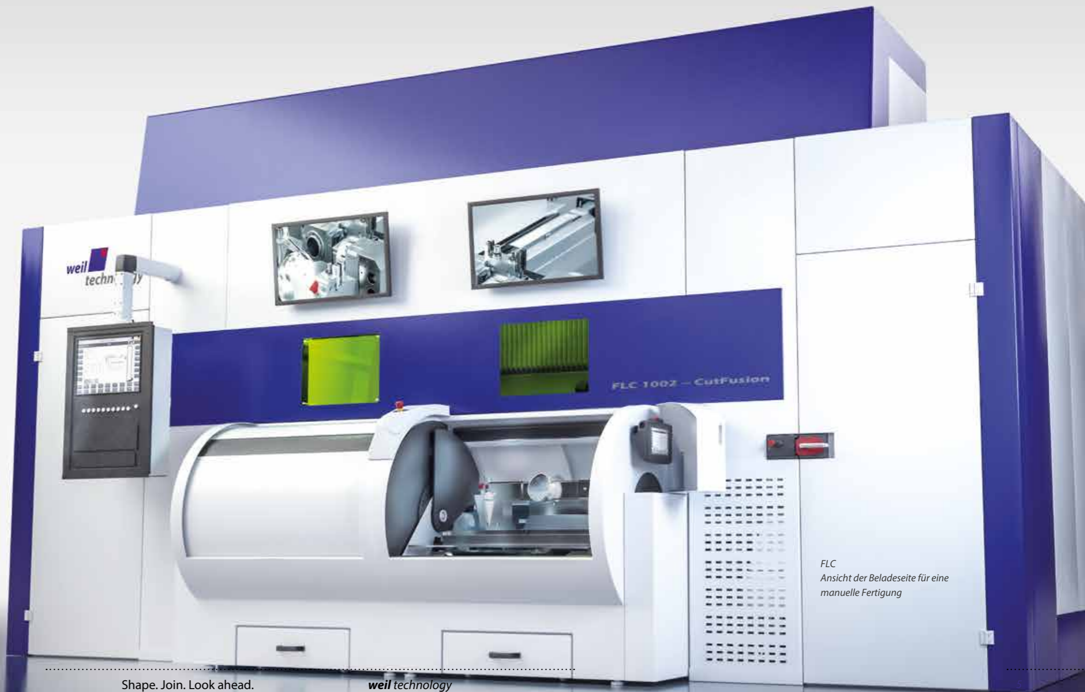
FLC Ansicht der Beladeseite für eine manuelle Fertigung