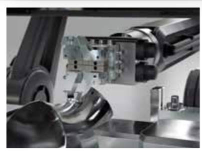
Interne und externe Automatisierung für die Fertigung hoher Losgrößen