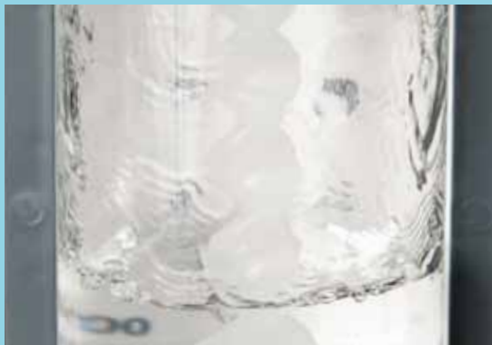
Titrationgefäß mit automatischer Spülvorrichtung

Auch die Wartungskosten sind dank sorgfältig ausgewählter Komponenten mit langer Lebensdauer minimal. Mit Reagenzien in Kontakt kommende Oberflächen sind aus korrosionsbeständigem Material gefertigt.