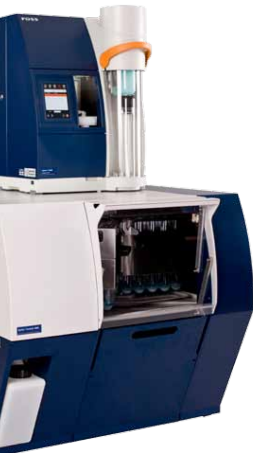
Verschiedene optionale Auto Sampler sorgen für die Automatisierung des Laborbetriebs bei jedem Probendurchsatz

All dies sind Gründe dafür, warum analytische Lösungen von FOSS optimale Ergebnisse liefern –Tag für Tag und Jahr für Jahr.