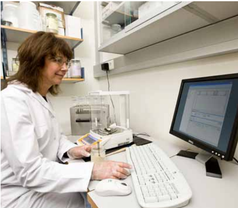
Die Compass Software ermöglicht eine umfassende Datenverwaltung.