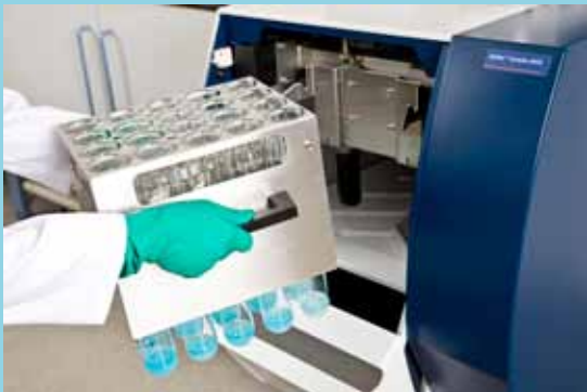
Setzen Sie einfach die Probengestelle direkt aus dem Aufschlussblock ein und das Kjelttec™ führt im unbeaufsichtigten Betrieb über vier Stunden lang genaue Analysen durch.