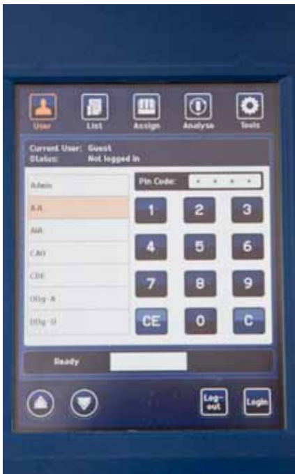
Die übersichtliche Benutzeroberfläche des Kjeltec™ 8400

Neben Leistungsmerkmalen wie Langzeitstabilität, breitem Anwendungsbereich, Geschwindigkeit und Einfachheit gewährleistet das System bei jeder Analyse höchste Genauigkeit, ohne dafür auf wiederholte und kostenintensive Kalibrationen zurückgreifen zu müssen.