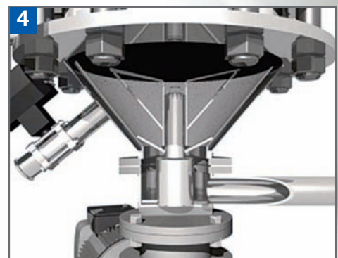
4 Fluidisierungstrichter mit Klumpenbrecher

Der Trichter ist mit einem Konus aus speziellem, porösem Material ausgestattet. Der Produktfluss von klebrigen oder schwer fließenden Pulvern wird mit Hilfe des, durch die Poren eindringenden Gases optimiert. Im Falle von leicht entzündbaren Produkten kann Schutzgas verwendet werden.