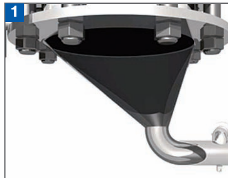
1 Standard Ansaug-Trichter

Der Standard-Trichter gewährt mit seinem speziellen Auslass-Winkelkonzept die vollständige Entleerung der Behälter. Die Grösse ist auf der einen Seite dem Behälter angepasst und auf der anderen Seite dem gewünschten PTS Modell. Das Standardmodell ist auch mit einem Fluidisierungsfilter zur Kontrolle des Pulverflusses ausgestattet.