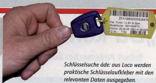
Schlüsselsuche äde: aus Loco werden praktische Schlüsselaufkleber mit den relevanten Daten ausgegeben.