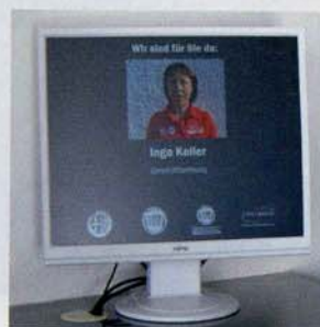
Auf dem Begrüßungsterminal läuft sympathische Eigenwerbung, wenn gerade kein angemeldeter Kunde erwartet wird