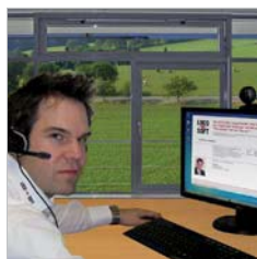
Loco-Soft Webinar: Trainer Kau ist live mit den Teilnehmern verbunden

Insgesamt sieben Module können die Anwender des Dealer-Management-Systems von Loco-Soft als Webinar buchen – von der Auswertung und Analyse über Faktura, Finanzbuchhaltung und Inventur bis hin zum Marketing und Werkstatt-Termin-Planer. Die Teilnehmer können vom eigenen PC aus an den Online-Schulungen teilnehmen.