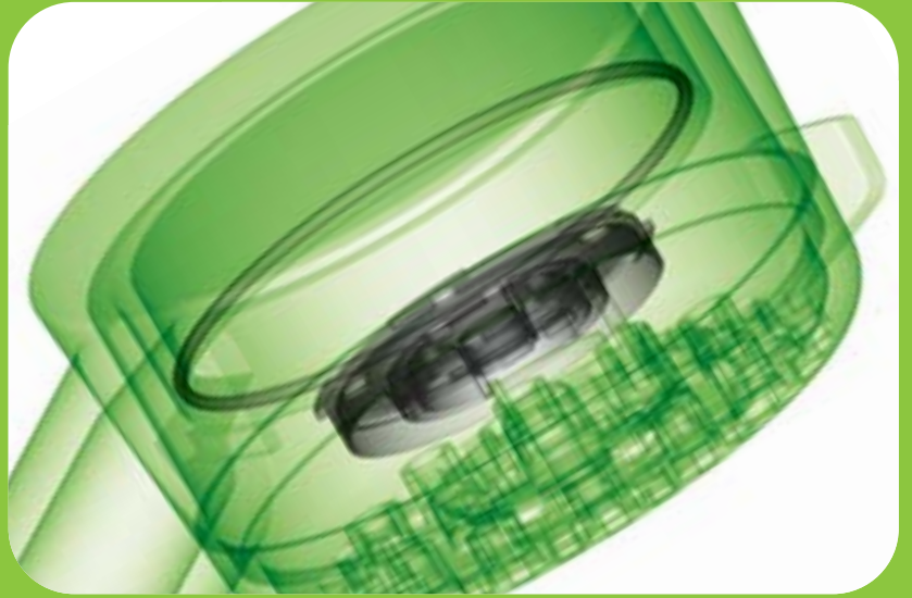
DICHTUNGEN VON KUBO TECH IN EINER DUSCHBRAUSE