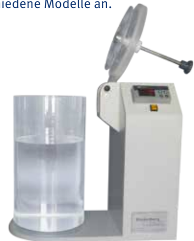
VERPACKUNGSTESTER DIGITAL KOMPAKTGERÄT, DURCHMESSER 190 MM ZUR DICHTIGKEITSPRÜFUNG VON VERSCHLÜSSEN, SIEGELUNGEN UND VERPACKUNGEN UNTER VAKUUM