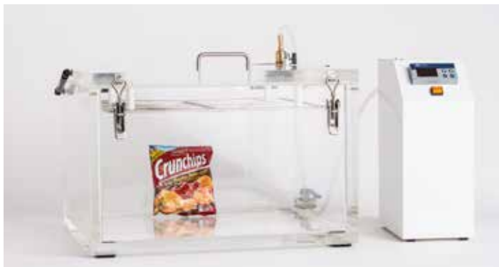
VERPACKUNGSTESTER DIGITAL Q, INNEN 500X400X300 MM, AUSSEN 600X490X450 MM

Beim üblichen Verfahren wird die Prüfkammer des Verpackungstesters zunächst mit Wasser befüllt. Anschließend wird die zu testende Verpackung unter der höhen-verstellbaren Tauchplatte platziert und ein Vakuum angelegt. Undichtigkeiten machen sich durch aufsteigende Bläschen bemerkbar. Dinkelberg Analytics bietet verschiedene Modelle an.