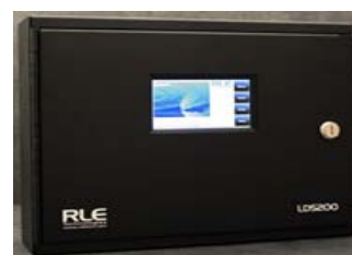
Remote-Controller zur genauen Identifizierung von Leckagen, Alarmierung und Einbindung in DCIM oder BMS