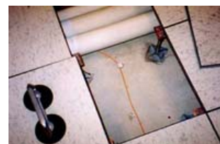
SC-Sensorkabel verlegt im Doppelboden