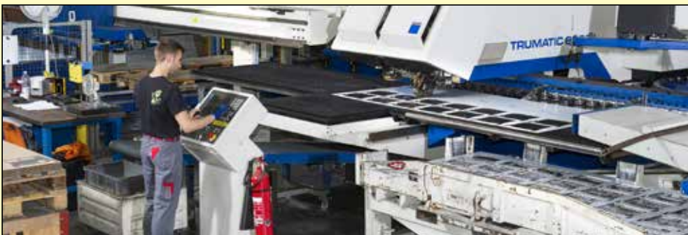
Trumpf Trumatic, servicegeplegt. Preis: 900000,- CHF, gegen Aufpreis kann Maschine geliefert werden. Da die Maschine aktuell noch in der Produktion eingesetzt wird, kann sie unter Realbedingungen besichtigt werden. Weitere Infos zu der neuen SMM-Rubrik im Neu-, Lager- und Occasionsmaschinenmarkt: Tel 044 720 77 12, media@vogel-media.ch. Beispielinserat mit 3 Feldern