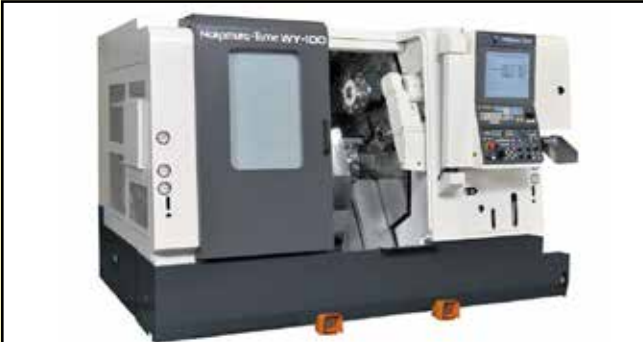
NC Drehzentrum Nakamura WY 100, 8 Achsen, 2 Spindeln, Stangendurchlass bis ø42: Weitere Infos zu der neuen SMM-Rubrik im Neu-, Lager- und Occasionsmaschinenmarkt: Tel 044 720 77 12, media@vogel-media.ch. Beispielinserat mit 2 Feldern