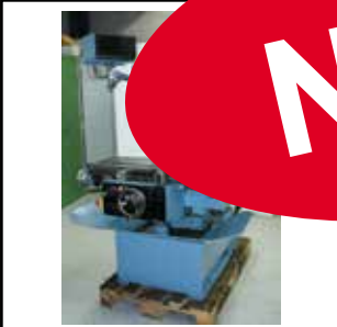
Schaublin 22, XY/Z - 330/400/475 mm, ISO 30, Hochpräzisions-Universalfräsmaschine in sehr gutem Zustand. Weitere Infos zu der neuen SMM-Rubrik: Tel 044 720 77 12, media@vogel-media.ch. Beispielinserat mit 1 Feld