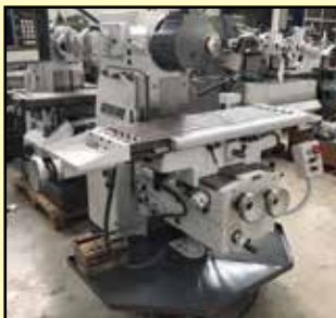
Reiden FU-150, Führungen neu eingeschabt, Spindeln revidiert. XYZ - 850, 250, 470, Drehzahl 45 bis 2000 U/min, Spindelauflaufnahme ISO 40. Weitere Infos zu der neuen SMM-Rubrik im Neu-, Lager- und Occasionsmaschinenmarkt: Tel 044 720 77 12, media@vogel-media.ch